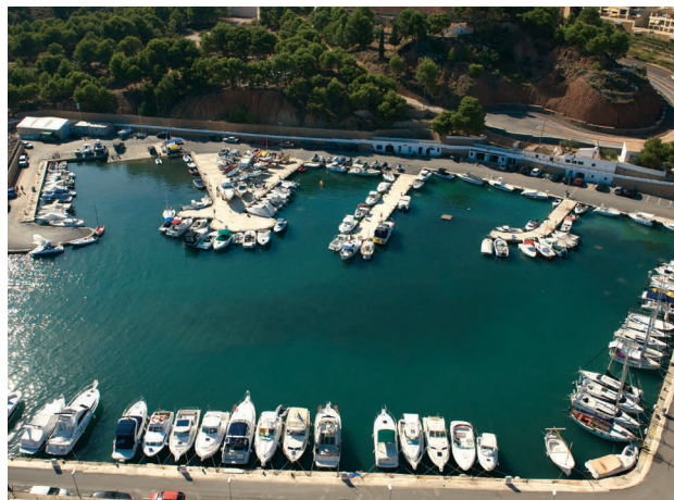
PUERTO DEPORTIVO PORTO SENSO Ptda. La Galera, 1 · T. 965 845 944