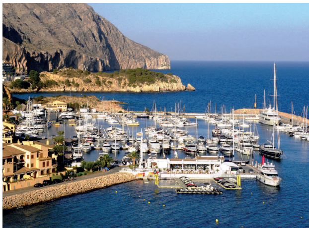
CLUB NÁUTICO CAMPOMANES (MARINA GREENWICH) · T. 965 842 200