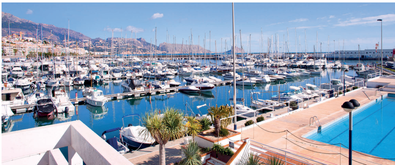
CLUB NÁUTICO DE ALTEA Av. del Puerto, 50 · T. 965 841 591